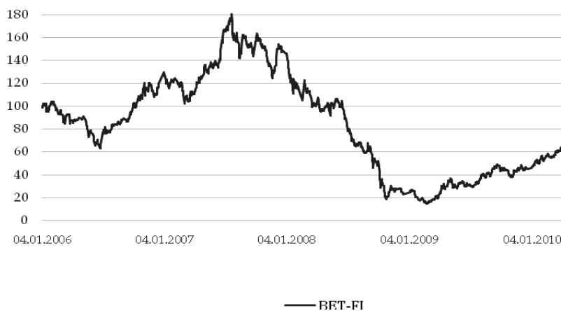
Evoluții refectate prin indicele BET-FI între anii 2006-2010

Din graficul comparativ al mișcărilor celor trei indici ai BVB se remarcă o corelație între evoluțiile acestora, semn că toate sectoarele economiei au fost afectate de criza mondială și că piața de capital românească, la fel ca toate piețele emergente, a fost printre primele de pe care capitalurile străine