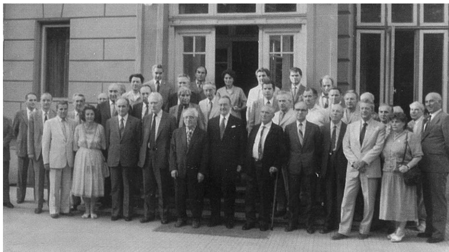
Eveniment la Academia Română. Grup de profesori de la ASE și colaboratori