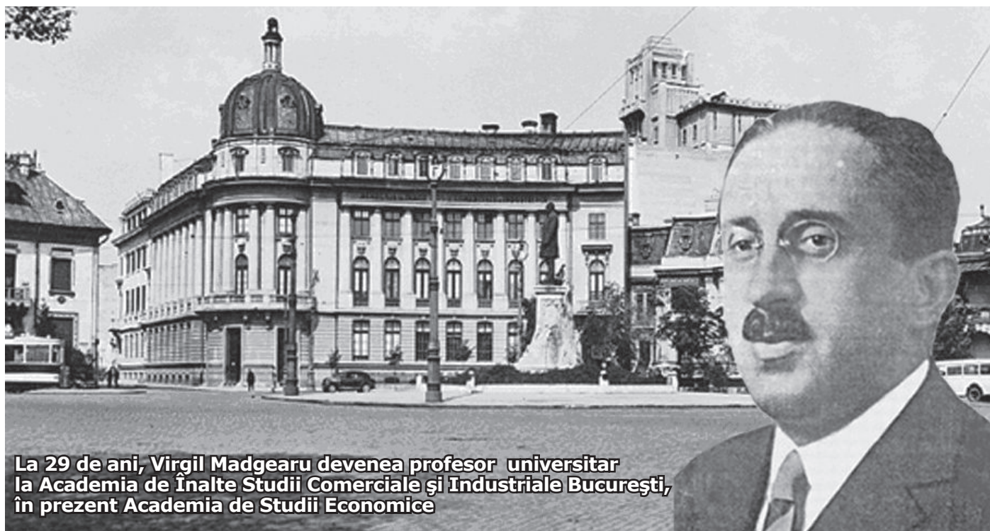
La 29 de ani, Virgil Madgearu devenea profesor universitar la Academia de Înalte Studii Comerciale și Industriale București, în prezent Academia de Studii Economice