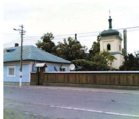
Casa părintească din Roman în care s-a născut Ion Ionescu de la Brad