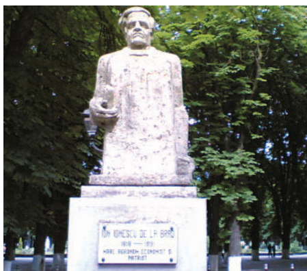
Bustul lui Ion Ionescu de la Brad din Parcul municipal din Roman

În urmă cu două secole, într-o casă din Roman, la 24 iunie 1818, se naștea Ion Ionescu de la Brad - unul dintre românii care aveau să contribuie la schimbarea înfățișării țării prin implicare sa în reforma agrară de la mijlocul secolului al XIX-lea. El mai este amintit, astăzi, din păcate, doar când vorbim de strada care-i poartă numele, de liceul din comuna Horia, sau când un trecător se uită la bustul marelui agronom din Parcul municipal. Agronom și statistician de înalt prestigiu național și internațional, Ion Ionescu de la Brad a copilărit pe strada din Roman care îi poartă numele. Școlit în Franța, a revenit în țară și, printre altele, a înființat prima școală agricolă în Moldova.