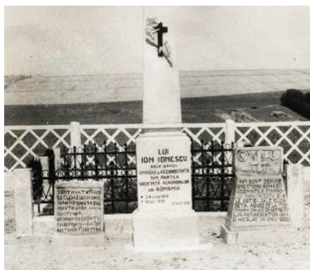
Mormântul lui Ion Ionescu de la Brad, din localitatea Brad