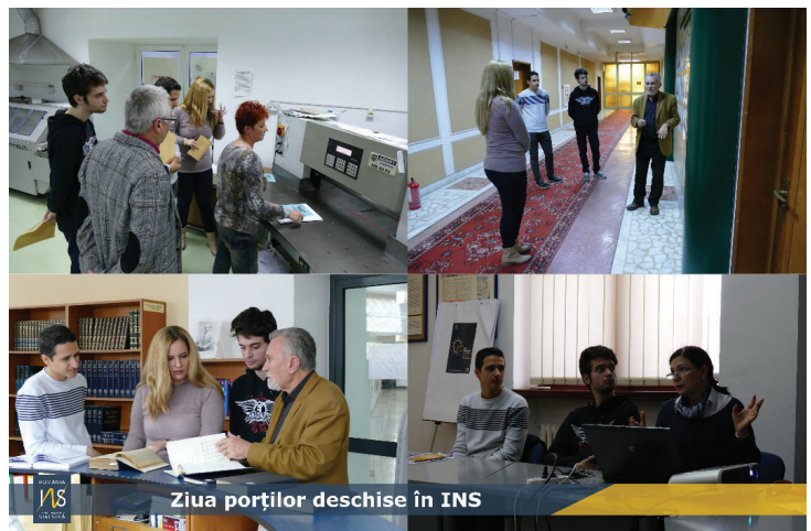
Ziua porților deschise în INS

ropene a Statisticii intitulată "Statistici mai bune pentru o viață mai bună".